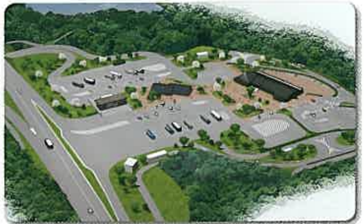
南相馬鹿島SA（セデッテかしま）